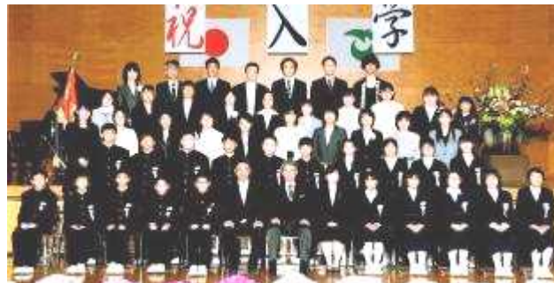
1年B組の生徒と保護者