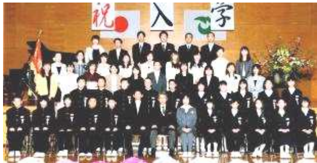
1年A組の生徒と保護者

入学式 (4月5日(水)) 本年度の新入生は、男子21人、女子19人、計40名の2クラスです。中学生は、子どもから大人へ大きく成長していく時です。自分のことは自分でできるようにする3年間にしてもらいたいと思います。