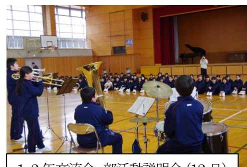
1・2年交流会、部活動説明会 (12日)