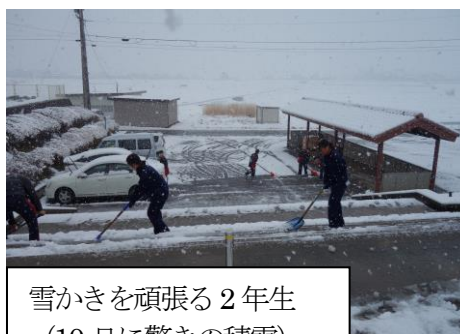
雪かきを頑張る2年生 (10日に驚きの積雪)