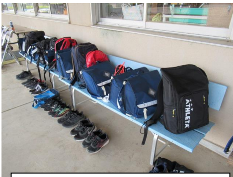
整理整頓はチーム力(サッカー部)