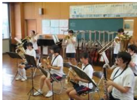
清流祭ステージ発表へ向けて