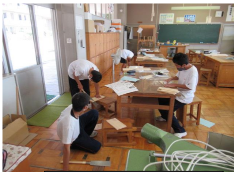
清流祭作品づくり(技術)