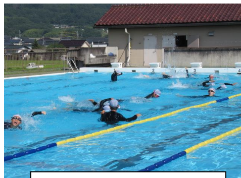
水しぶきと歓声(保健体育)