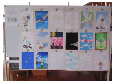
清流祭選抜ポスター