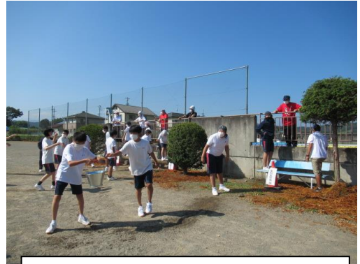
声を掛け合いながらのバケツリレー