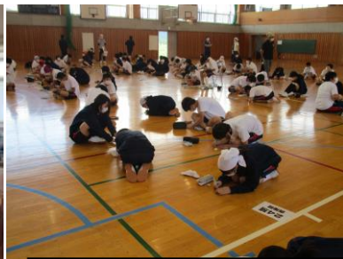
縦割り清掃生徒集会（美化）