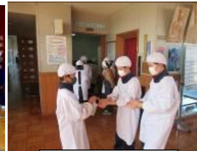
給食前の消毒（給食）