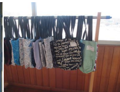
エコバック (2年家庭)