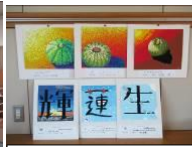
文字のデザイン&点描 (1年美術)