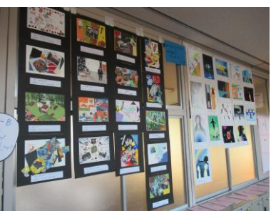
空想画&コラージュ (3年美術)