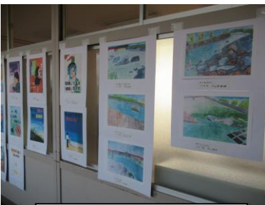
絵画&ポスター (2年総合美術)