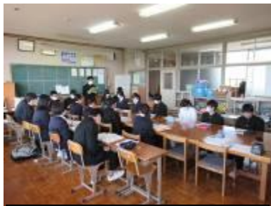
第1回生徒総会（本部・評議員）