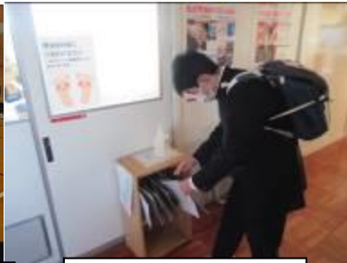
朝の健康観察（保健）