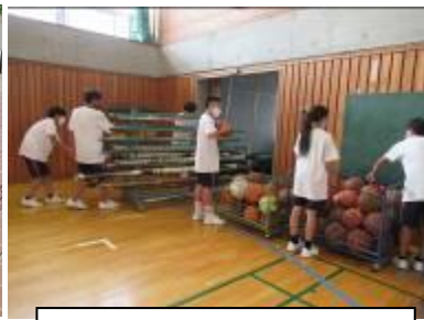
体育館器具庫の清掃（体育）