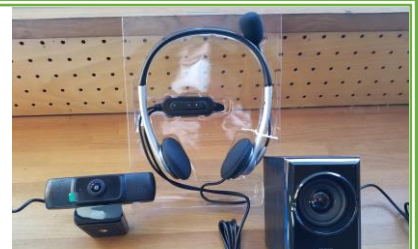
オンライン授業用ICT機器

国の新型コロナウイルス感染症対策事業として配当された学校保健特別対策事業補助金を活用し、本校では消耗品として消毒関係やオンライン授業用ICT機器、非接触型電子体温計等、備品としてWeb高感度マイクや保健室カーテン、業務用空気清浄器を発注・購入させていただいておりますのでご承知おきください。