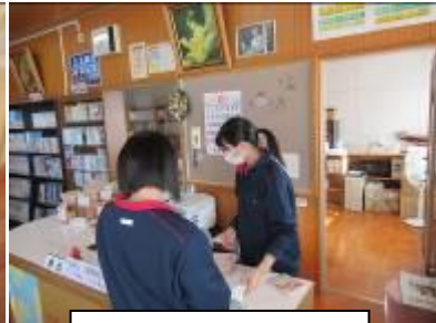
本の貸し出し（図書）