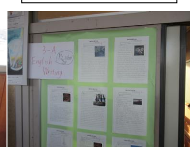
My school trip (3年英語)