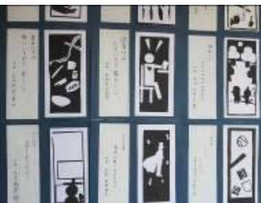
川柳切り絵 (2年美術)