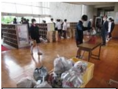
アルミ缶・エコキャップ収集（厚生）