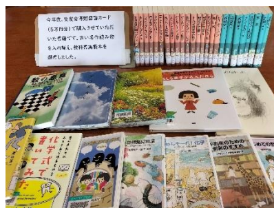
〈浅科校友会から今年度も図書カード〉