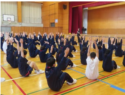
ストレッチ講習会